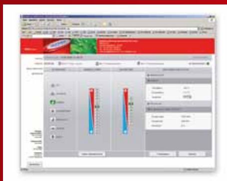
Benutzeroberfläche web control ®